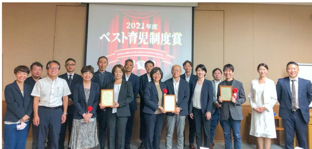
2021年度イクハクベスト育児制度賞表彰式 2022年9月22日

2021年度 ベスト育児制度賞表彰式 2022年9月22日 @大阪市ドーンセンター